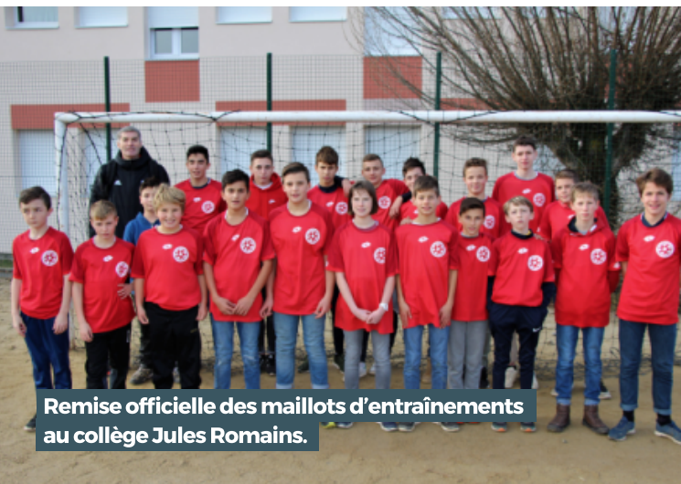
Remise officielle des maillots d'entraînements au collège Jules Romains.