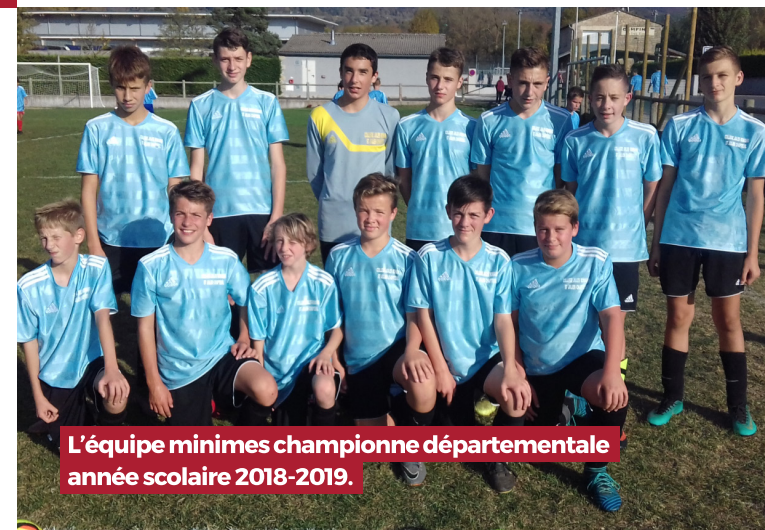
L'équipe minimes championne départementale année scolaire 2018-2019.